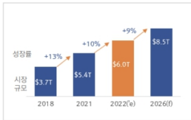
(*) 출처 -FIS 글로벌 결제 보고서 2023

한국은행 ‘2024년중 전자지급서비스 이용현황’ 보도자료에 따르면 전자지급 결제 대행서비스(PG) 이용규모는 일평균 2,936만건, 1조 3,676억원으로 전년 대비 각각 12.9%, 11.3% 증가하며 지속적인 성장세를 기록하고 있습니다. 반면 전 세계 40개 시장의 오프라인 및 온라인 소비자 결제 시장에 대한 조사한 결과에 따르면 지속적으로 확대되고 있는 글로벌 전자상거래 거래액은 2022~2026년 연평균성장률 9%로 성장하여 2022년 약 6조 달러(약7,833조 원)에서 2026년 8조 5,000억 달러(약 1경 1,096조 7,500억 원) 이상으로 증가 할 것으로 예상됩니다.